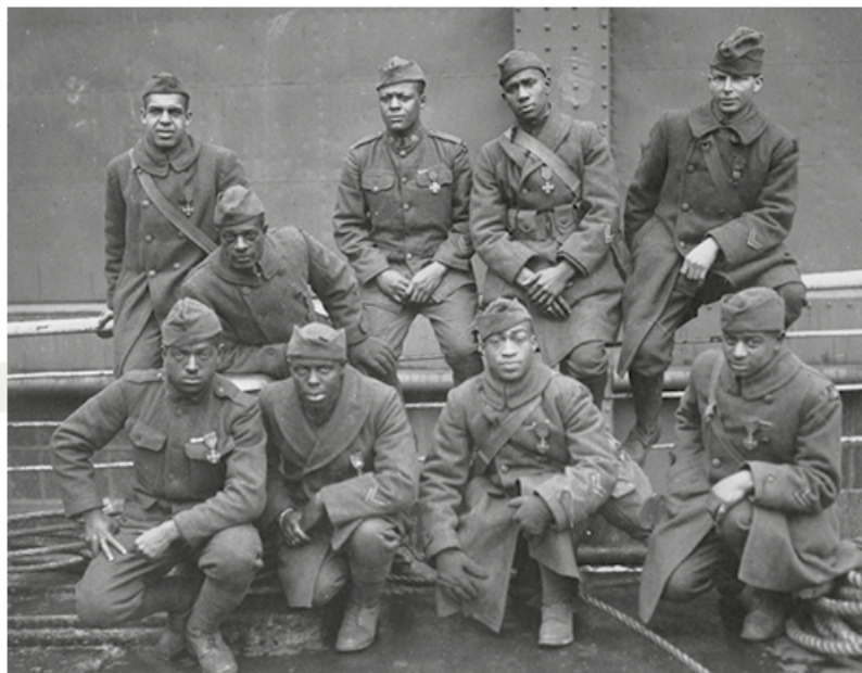
Harlem Hellfighters ayant reçu la croix de guerre en 1919

Les quatre régiments de la 93e division eurent 584 tués et 2 582 blessés, ce qui représente 32 % de son effectif. Un insigne divisionnaire que ses régiments ont adopté à la fin de ce conflit, représentait un casque Adrian bleu clair rappelant leur participation à la Première Guerre mondiale avec l'armée française. En décembre de cette année, ils repassent sous l'autorité du GQGA qui ne les autorise pas à parader dans les rues de Paris. Les quatre régiments embarquent pour les États-Unis dès janvier 1919. Pour le GQGA, il n'est pas question de laisser ces soldats en période de paix dans un pays ne connaissant pas la ségrégation raciale au contact d'une population qui pourrait leur donner des prétentions nouvelles en matière de liberté. Un Député de la Guadeloupe René Boisneuf rapportera même à l'Assemblée Nationale en Juillet 1919 des exemples de mauvais traitement des troupes noires