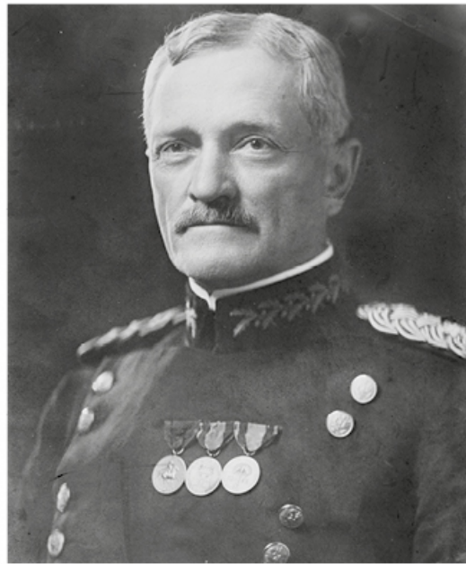
Général John-Joseph Pershing

Mais il faut attendre janvier 1918 pour que le général Pershing soit en mesure de donner des précisions au général Pétain sur les troupes qu'il lui a promis, que les tergiversations américaines vont retarder, régiment en sous-effectif, travaux de grande importance sur les lignes de communication qui serait préférable de terminer, parce que plus utile à la cause commune... puis polémique sur l'équipement de ces soldats qui ne conservent de la tenue américaine que leur uniforme en drap kaki et regrettent de ressembler à des soldats français coloniaux.